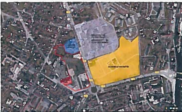
Figure 1: Plan de localisation du projet