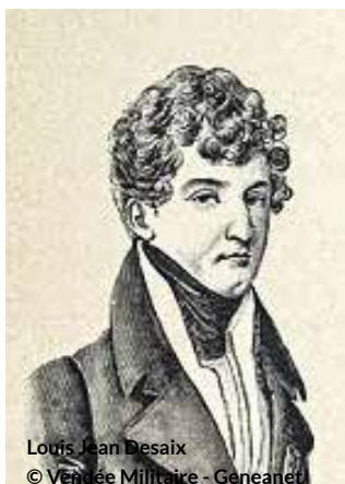
Louis Jean Desaix