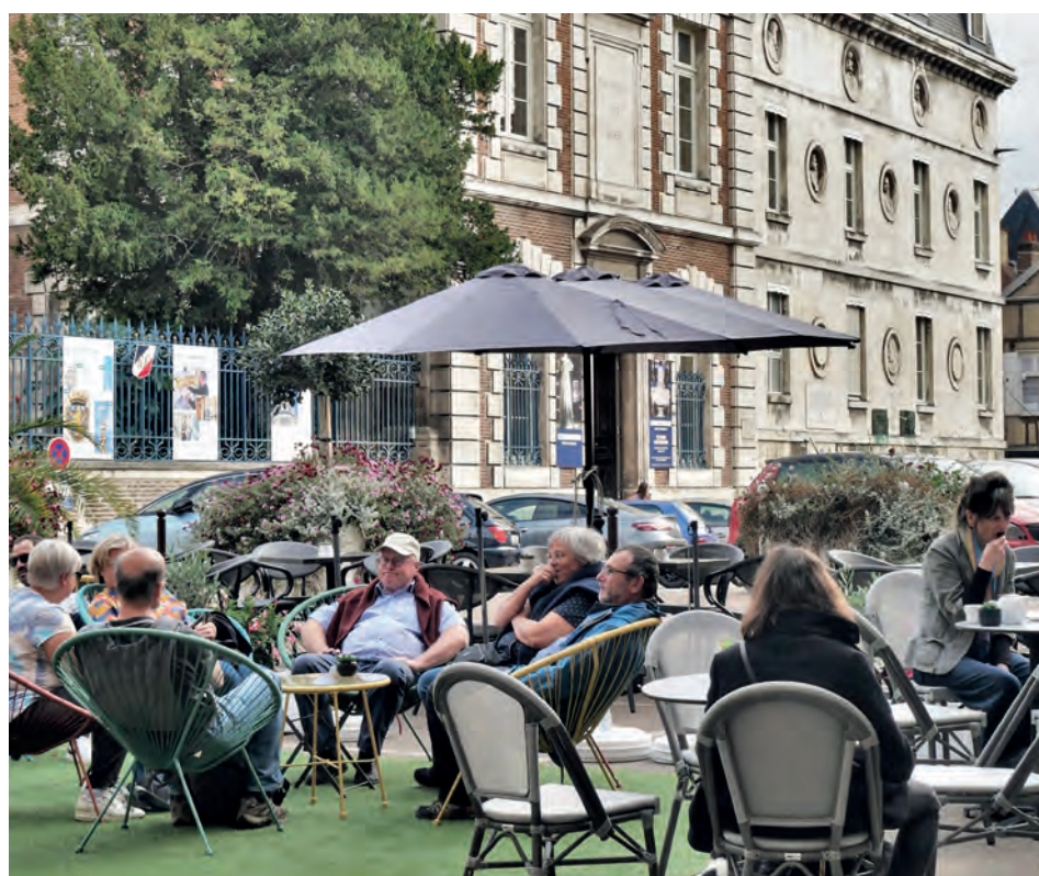
Place Maréchal-Leclerc Suite à la rénovation de la Tour de l'Horloge, l'aménagement de cette place centrale d'Auxerre a permis de rendre l'espace public aux piétons et aux terrasses. Et ce n'est qu'un début...