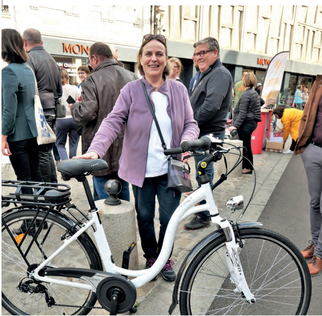
Première journée de la mobilité Un jeu concours a permis de faire gagner un vélo électrique.