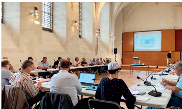
Lors du conseil des maires s'est tenu le 5 septembre à l'abbaye Saint-Germain.

d'une réorganisation de la collecte de la Communauté de l'Auxerrois avec un passage de 11 à 9 tournées quotidiennes, afin d'améliorer les conditions d'exercice du service. Suite à ces propositions, les agents ont repris le travail le vendredi 9 septembre, permettant une reprise progressive des tournées habituelles. La réorganisation définitive de la collecte des déchets devrait être officialisée en octobre. Nous vous tiendrons évidemment informés de ces changements. •